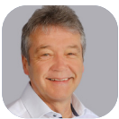
Musikwettbewerbe, Unterhaltung Beat Weber