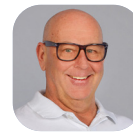
Bauten Roland Bollin